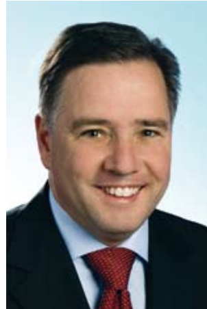
Markus Sackmann Staatssekretär im Bayerischen Staatsministerium für Wirtschaft, Infrastruktur, Verkehr und Technologie

Bayern setzt konsequent auf Existenzgründer. Wir brauchen junge Unternehmen zur Bewältigung des wirtschaftlichen Strukturwandels und um neue zukunftsfähige Arbeitsplätze zu schaffen. Eine ausgeprägte Gründerkultur ist ein entscheidender Baustein zur Revitalisierung des Unternehmertums als Kernbestandteil der Sozialen Marktwirtschaft. Die Förderung von Existenzgründungen ist deshalb ein zentrales und unverzichtbares Element bayerischer Wirtschaftspolitik.